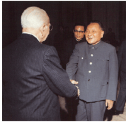
(Christ' s Apostle in the Orient)